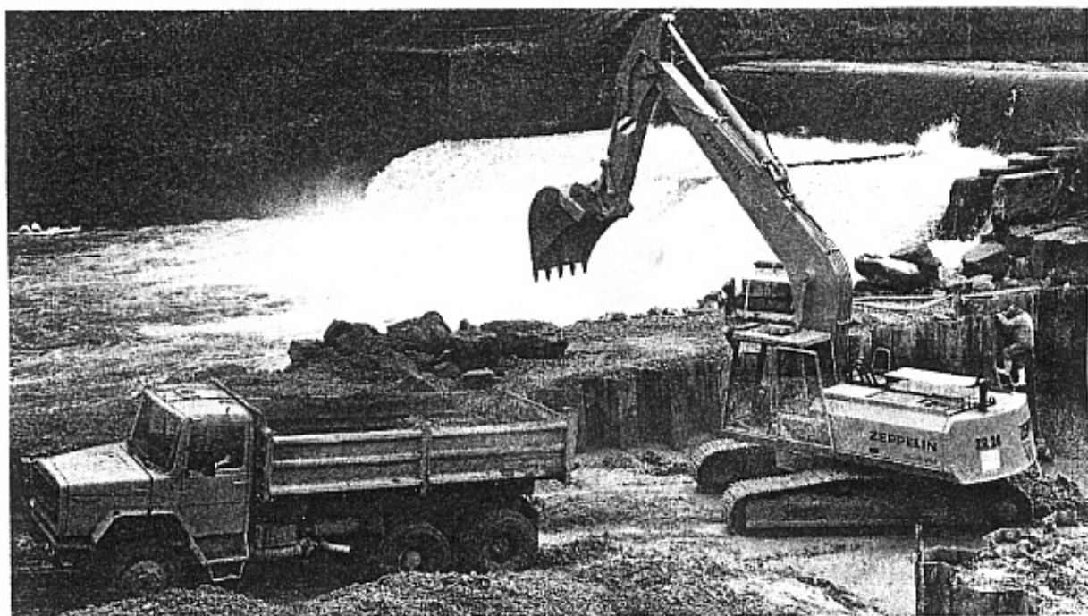
Einen Zeppelin-Raupenbagger vom Typ ZR 28 setzt das Unternehmen beim Bau eines neuen Wasserkraftwerks an der Wertach in Türkheim ein.

Innerhalb von nur zehn Jahren hat sich die Firma A. Scharpf Erd- und Tiefbau, 87778 Erisried-Stetten, im Spezial-Wasserbau einen Namen gemacht. Private Bauherren, Gemeinden, Wasserverbände, Genossenschaften und kommunale Wasserwerke gehören heute zu den Auftraggebern aus einem Umkreis von mehreren hundert Kilometern.